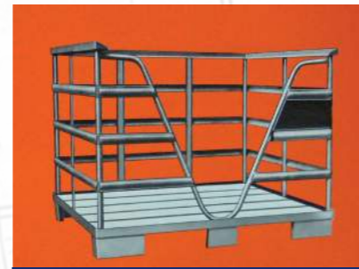
BOX-Palette nach DIN 15142; 1970er