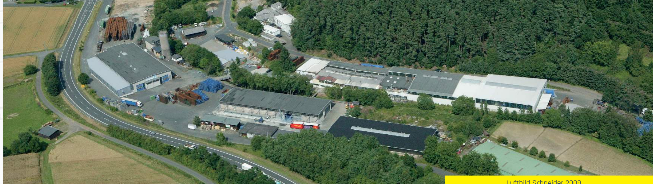
Luftbild Schneider 2008