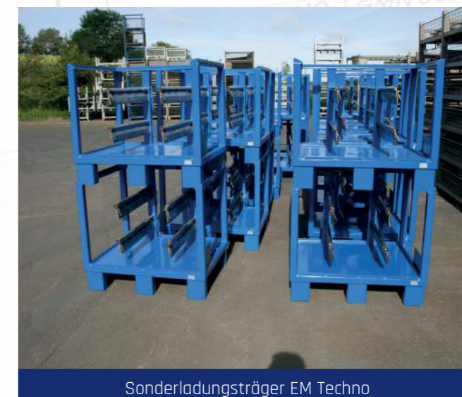
Sonderladungsträger EM Techno