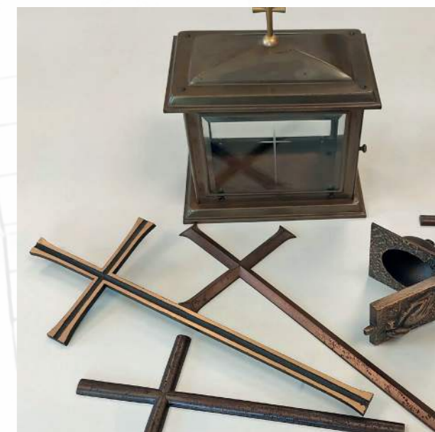
Die ersten Produkte 1963

Bereits nach wenigen Jahren platzt die Werkstatt aus allen Nähten. 1965 kauft das Ehepaar Schneider deswegen ein Grundstück außerhalb des Dorfes und lässt dort 1967 eine moderne Werkstatt errichten. Dort befindet sich die Firma Schneider bis heute.