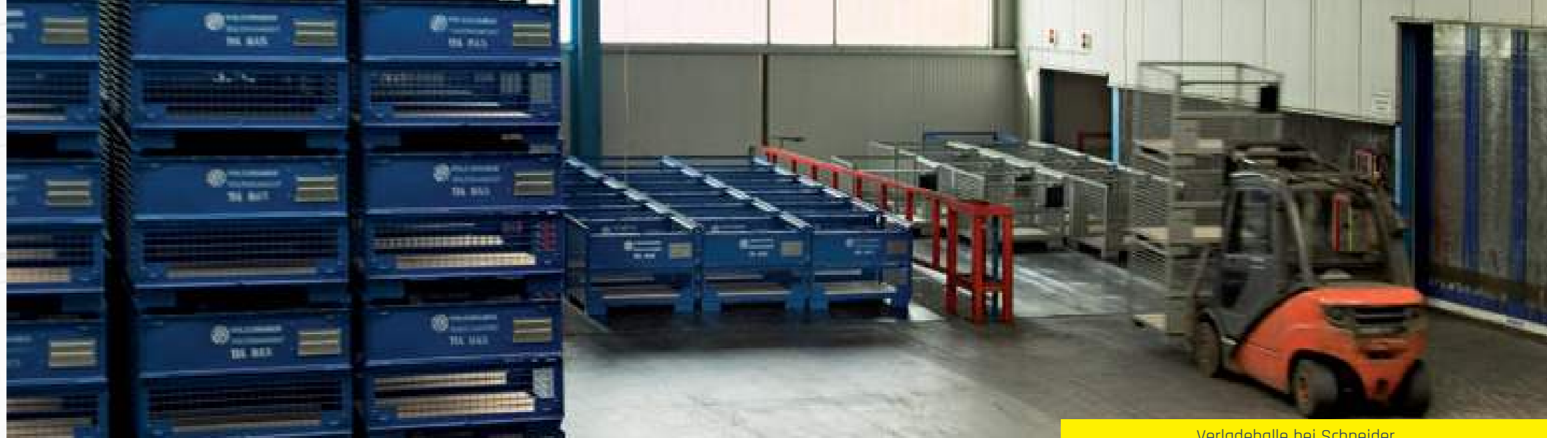
Verladehalle bei Schneider

Um das Unternehmen auch international wieder zu etablieren, entsteht 2001 ein eigenes Vertriebsbüro in Frankreich. Bis 2005 hat sich der Standort in Oberdieten schließlich so weit vergrößert, dass eine weitere Erweiterung kaum möglich ist.