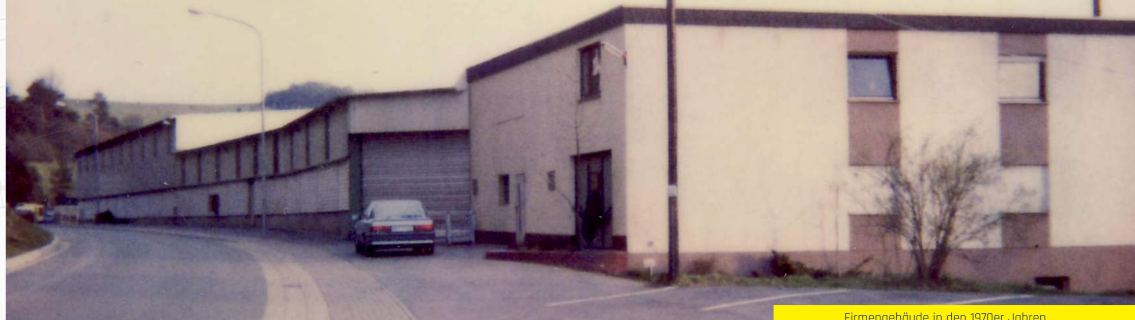
Firmengebäude in den 1970er Jahren