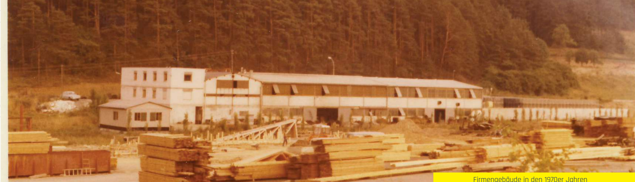
Firmengebäude in den 1970er Jahren