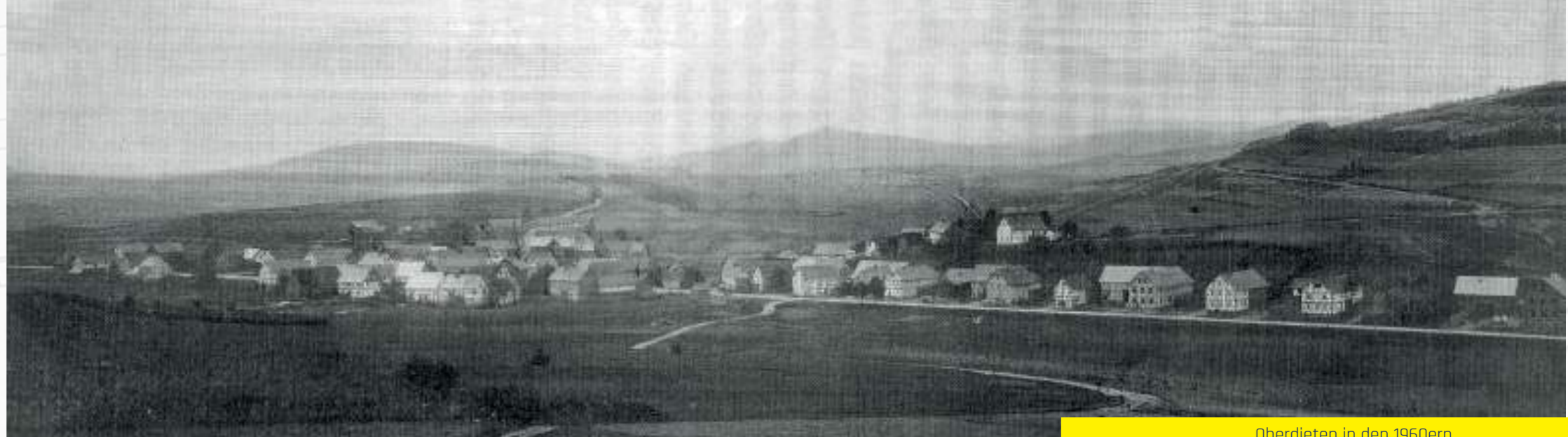
Oberdieten in den 1960ern