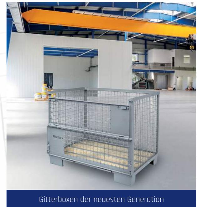
Gitterboxen der neuesten Generation

Bereits nach wenigen Jahren platzt die Werkstatt aus allen Nähten. 1965 kauft das Ehepaar Schneider deswegen ein Grundstück außerhalb des Dorfes und lässt dort 1967 eine moderne Werkstatt errichten. Dort befindet sich die Firma Schneider bis heute.