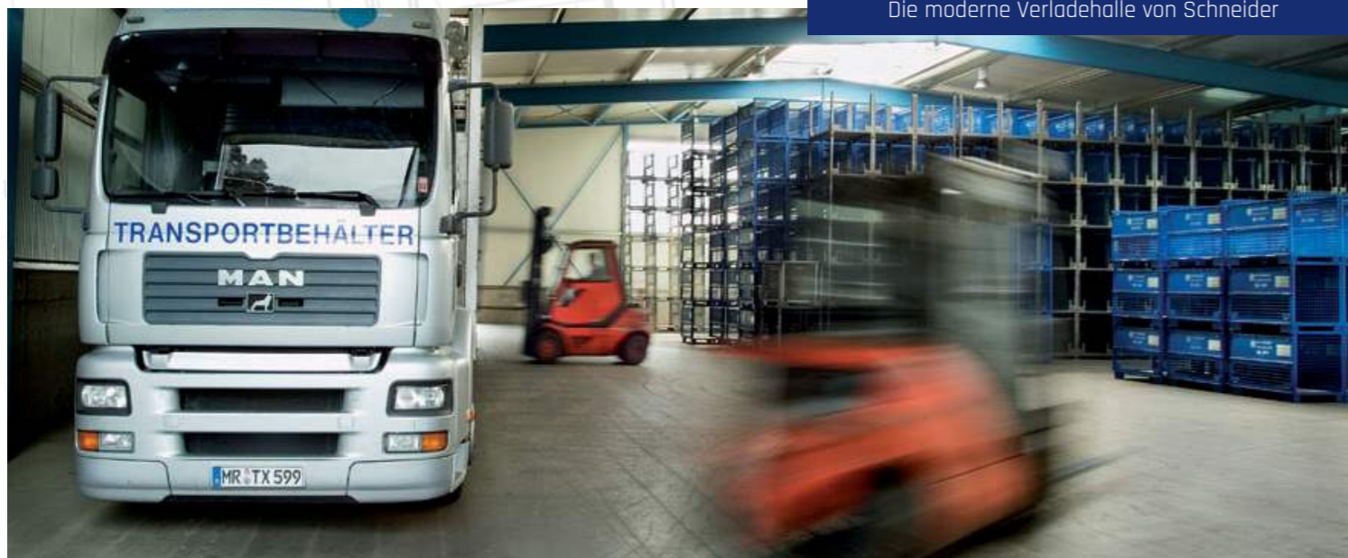
Die moderne Verladehalle von Schneider

Die MitarbeiterInnen erhalten nun klar umrissene Aufgabebereiche, der Vertrieb eine einheitliche Strategie und die Abteilungen in der Produktion werden voneinander abgegrenzt. Die bedeutendste Veränderung betrifft die Abteilung der Sonderladungsträger, die vollständig in das neue polnische Tochterunternehmen ausgelagert wird.