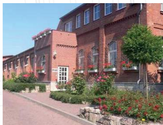
Das Weimarer Zweigwerk

Doch die hohen Investitionskosten belasten zunehmend auch das Unternehmen in Oberdieten. Letztlich steht die Firma Schneider vor der Insolvenz. Doch Rettung kommt schließlich aus der eigenen Familie.