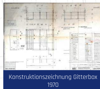
Konstruktionszeichnung Gitterbox 1970