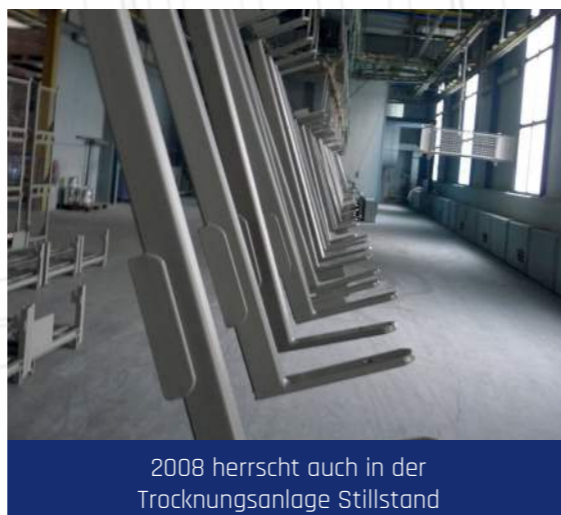
2008 herrscht auch in der Trocknungsanlage Stillstand

Dieses besonnene Vorgehen zahlt sich aus. Denn ebenso schnell, wie die Aufträge wegfallen, kommen sie Ende 2009 wieder zurück. Zum 50-jährigen Jubiläum 2013 kann das Unternehmen die Produktion auf 1.000 Gitterboxen pro Tag steigern und etabliert sich als bedeutende Branchengröße in Deutschland. Auch die Modernisierung kann dank neuer Maschinen und einer eigenen Pulverbeschichtungsanlage fortgeführt werden.