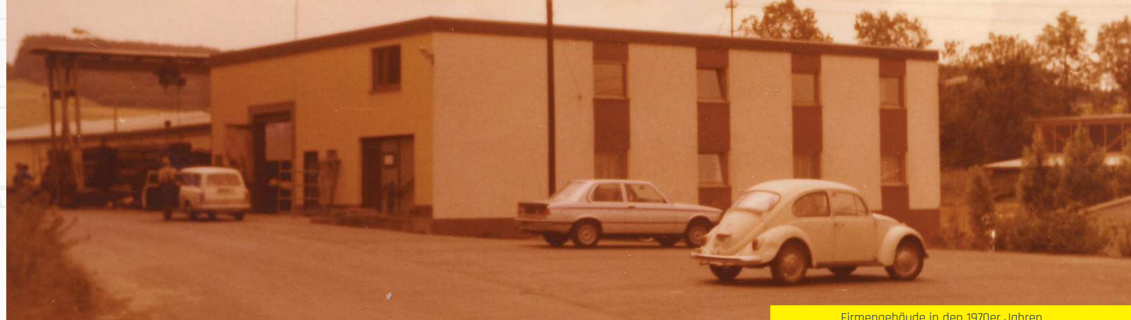
Firmengebäude in den 1970er Jahren