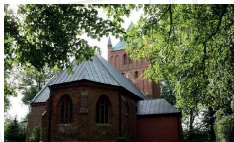
Die Dorfkirche in Bast

Seit ihrer Gründung 1963 befindet sich die Firma Schneider Transport- und Lagerbehälter in Oberdieten im Nordhessischen Hinterland. Die Geschichte des Unternehmens beginnt aber etwa 800 Kilometer weiter nordwestlich an der heute polnischen Ostseeküste. Dort wird Horst Schneider 1925 im Dörfchen Bast geboren, erlernt das Schlosserhandwerk und wird schließlich im Zweiten Weltkrieg vertrieben.