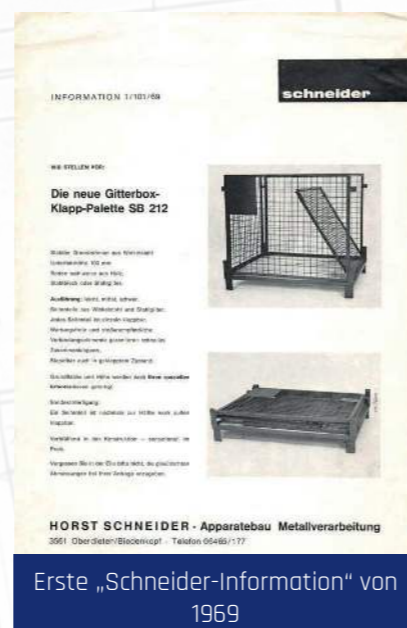
Erste „Schneider-Information“ von 1969

Dank dieser Projekte gelingt der Einstieg in die Gitterboxproduktion. Zunächst fungiert Schneider zwar ausschließlich als Subunternehmer seiner Kunden, doch noch im selben Jahr werden eigene Entwicklungen, wie die Schneider-Gitterbox-Klapp-Palette präsentiert.