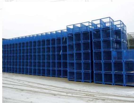
Schneider-Gitterboxen in den 1990er Jahren

Da das Gebäude über eine eigene Farbanlage und einen Verwaltungstrakt verfügt, scheint die Investition in ein Zweigwerk überaus erfolgsversprechend. Die Halle in Weimar ist jedoch in einem weitaus schlechteren Zustand, als erwartet und der erhoffte neue Absatzmarkt in Ostdeutschland erweist sich als Fehleinschätzung.