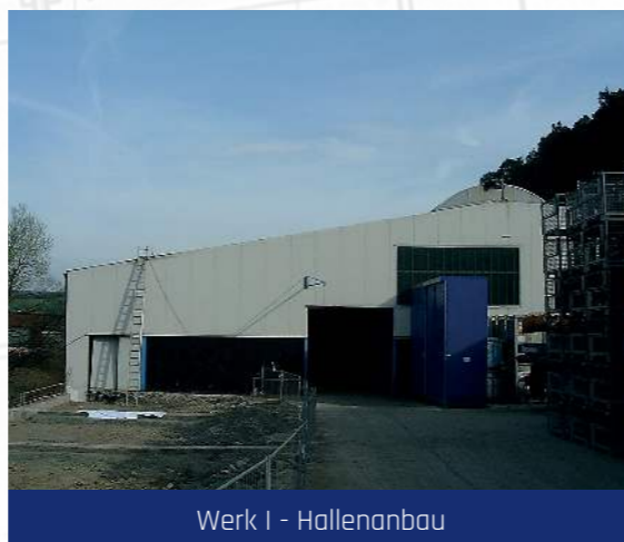
Werk I - Hallenanbau

Als 2006 die benachbarte Zimmerei Insolvenz anmeldete, bietet sich die einmalige Gelegenheit, in direkter Umgebung neue Produktionsstätten einzurichten. Bis 2008 werden die alten Hallen saniert. Die ursprüngliche Fabrikhalle wird zu Werk I umgewandelt und mit der Eröffnung der Werke II, III und IV bietet sich auf insgesamt 10.000 m 2 Hallenfläche Platz für weiteres Wachstum und ausreichender Lagerhaltung.