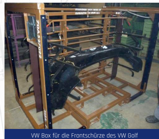
VW Box für die Frontschürze des VW Golf